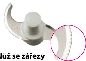
Nůž se zářezy